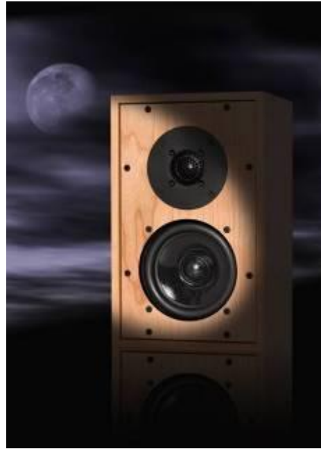
CHARTWELL LS3/5 BBC Licenced Monitor